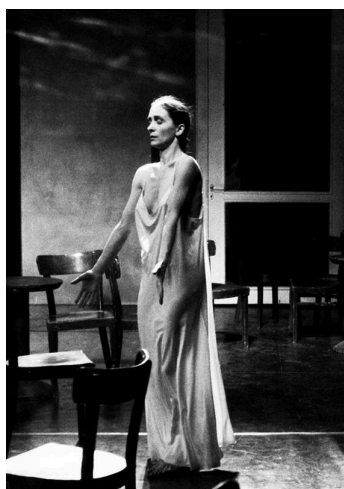
1 | Pina Bausch in Café Müller , foto di Ulli Weiss.

[...] se punta a una nuova creazione, o a delle nuove letture, oppure se emana delle promesse o il potenziale dell'archivio e del repertorio emancipandosi dalle supposte 'intenzioni' dell'autore, o ancora se cerca un'attivazione per il presente. Non presuppone [...] l'esistenza di un referente ben circoscritto, 'originale' e autentico, che bisognerebbe ritrovare e ricostruire, evacuando così il lavoro di trasformazione operato dalle riprese ulteriori o presenti (traduzione a cura dell'autrice).