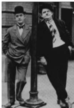
a sin. Aglio e Olio a dex. Stan Laurel e Oliver Hardy