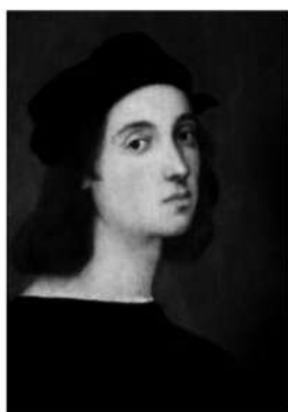
a sin. Rapanello Sanzio a dex. Raffaello Sanzio, Autoritratto (1506)