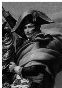
a sin. Mapoleone a dex. Jacques-Louis David, Napoleone sul San Bernardo (1800 - 1801)