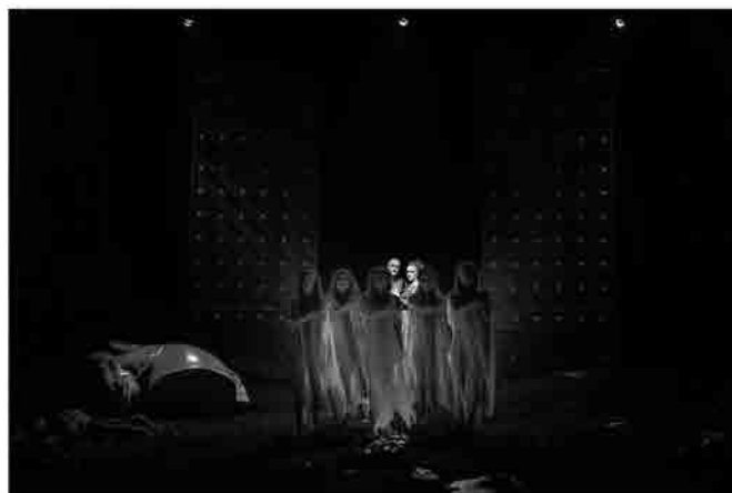
Ingresso del Coro

quasi sempre attraverso la figura della sineddоче: più che raccontare, gli inserti si incaricano di evocare, di suggerire, di alludere. Come mai questa soluzione in levare?