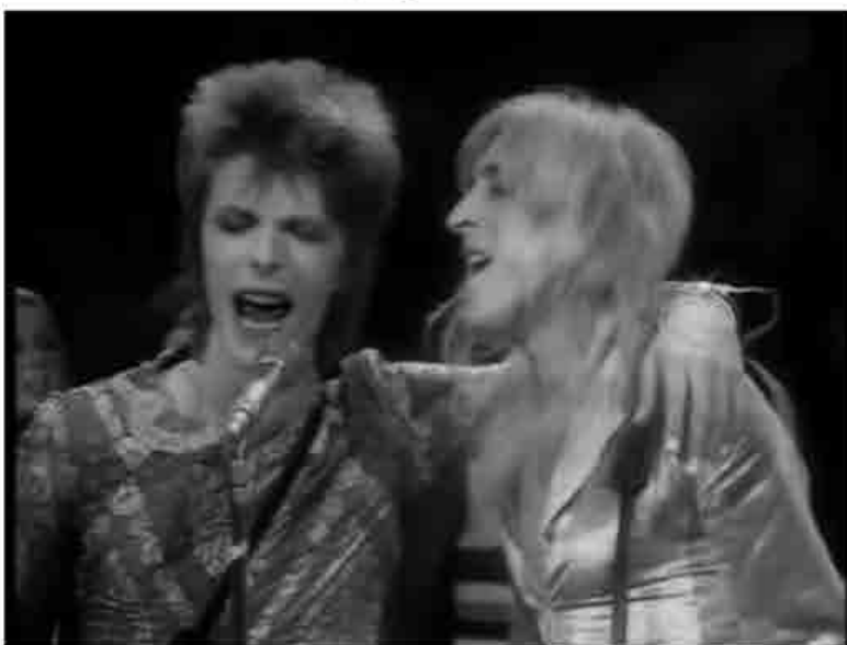
David Bowie canta Starman a Top of the Pops nel 1972, abbracciando Mick Ronson.

Ziggy Stardust nasceva come progetto per un musical ispirato a Vince Taylor, un emulo britannico di Elvis che in seguito al temporaneo successo e al consumo di droghe, era entrato in una sorta di delirio di onnipotenza mistico. Da qui divenne invece il tema per un album e per un tour che inizialmente veniva ospitato nei pub, per poche decine di spettatori, ma rapidamente crebbe di successo fino ad occupare le copertine dei magazine e le pagine dei quotidiani britannici. La creatura narrativa – e assieme reale – risultò di tale pregnanza che Bowie decise di doversene liberare