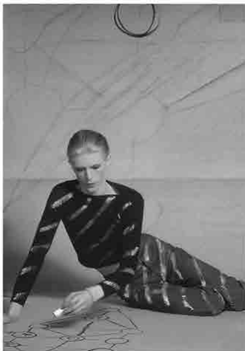
David Bowie traccia disegni cabalistici nella seduta fotografica per il retro della copertina dell'album Station To Station (1976).

Tra il 1976 e il 1980 Bowie sviluppò in modo più maturo quell'idea di espressione artistica che inseguiva dall'inizio della sua carriera. Le intuizioni, gli stimoli, i modelli a cui aveva guardato e continuava a guardare in tutte le direzioni, dalla letteratura al teatro al cinema alle arti visive, stavano coagulando in un unico progetto espressivo di matrice prevalentemente sonora. "Il rock, egli asseriva, è almeno una decina d'anni indietro rispetto alle altre arti, forse più: negli anni settanta il rock è appena arrivato al dadaismo" (Watts 1978). Ecco perché era necessario attingere ad un panorama di fonti creative molto più ampio della musica rock stessa. Nel tour di quell'anno Bowie eliminò pantomime e teatralità per concentrarsi totalmente sull'evoluzione e sulla sperimentazione della dimensione sonora, così come aveva fatto, dichiarandolo in modo esplicito, nel corso della composizione dei tre album berlinesi.