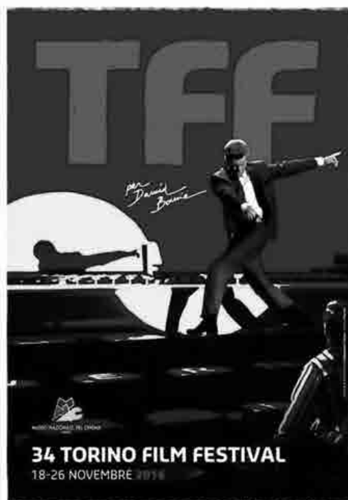
Manifesto del 34. Torino Film Festival, 2016.