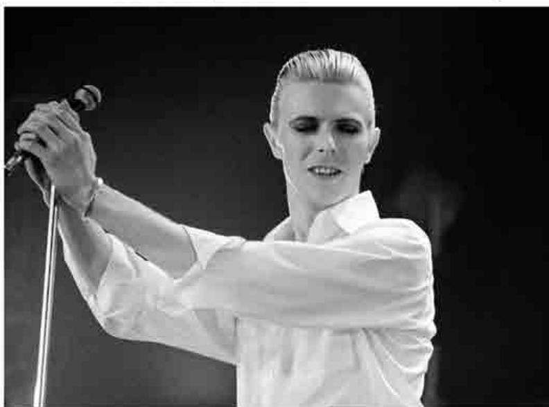
David Bowie dal vivo, Falkoner Teatret, 29 Aprile 1976 a Copenhagen, Danimarca, Isolar Tour.

In quel periodo Bowie si era circondato di numerosi musicisti appartenenti all'area del rock più incline alla complessità tecnica e strumentale: Brian Eno, Robert Fripp, Tony Kaye, Adrian Belew, Roy Bittan sono tutti nomi di musicisti che appartengono al gotha del rock del periodo e che contribuirono a condurre la musica di Bowie verso una dimensione lontana dalle sgargianti provocazioni del glam , affine invece a una ricerca sonora contraddistinta da una certa cupezza, talvolta un velo pretenziosa (come lo stesso Bowie la definì). Atmosfere che però si alternavano a momenti del tutto differenti nei quali riemergeva quella che potremmo definire la sua linea soul-dance , quella che si era concretizzata qualche anno prima con