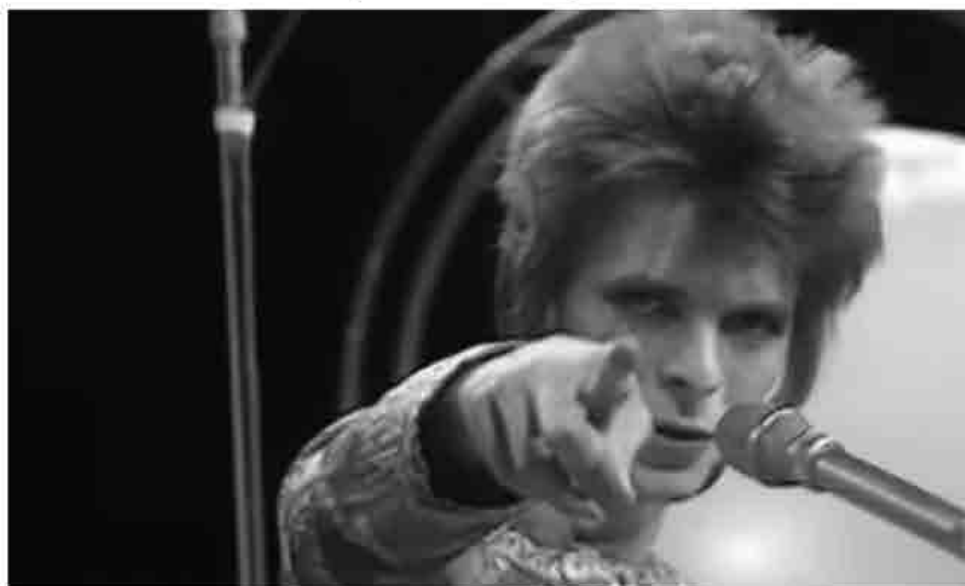
David Bowie canta Starman a Top of the Pops nel 1972, indicando verso la telecamera.

La musica rock all'inizio degli anni Settanta viveva un periodo di crisi di riferimenti e il suo ruolo nella società stava mutando. Tramontava la mitologia giovanile di una società basata sulla collettività della quale la musica sarebbe stata assieme colonna sonora e strumento di cambiamento. Allontanandosi dal realismo quotidiano, la musica prendeva la direzione della dimensione visiva e della dimensione fantastica. Il genere progressive ne era la più evidente rappresentazione: uso di costumi e travestimenti in scena (ad esempio Peter Gabriel con i Genesis), diffusione di copertine con grafica e disegni densi di narrazioni e figure fantasy. La teatralità era entrata nella musica rock e stava fungendo da meccanismo di trasformazione. Nel 1967 con Sgt. Pepper dei Beatles era nato il concept album, un tutto tematico che comprendeva le canzoni in quanto singole parti. Non va dimenticato che in quell'occasione anche i Fab Four si travestirono da componenti di una banda, sebbene solo per le foto di copertina.