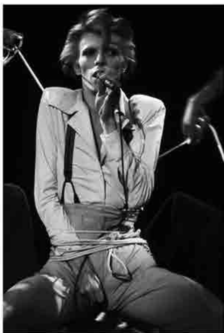
Bowie canta mentre viene legato con le corde; Universal Amphitheatre, Los Angeles 1974. Diamond Dogs tour.