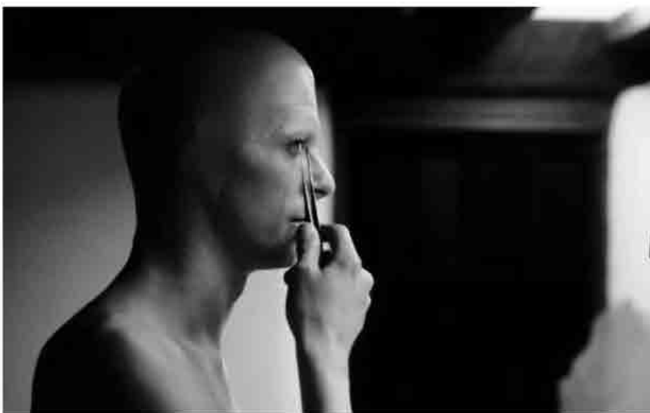
David Bowie al trucco per il trailer di The Man Who Fell to Earth, New Mexico 1975.