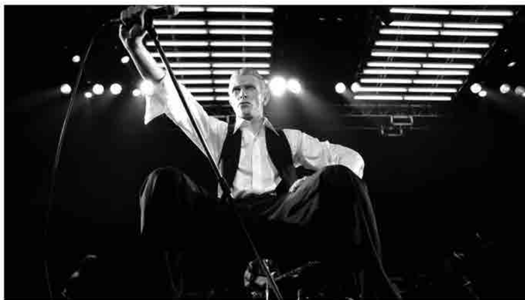
David Bowie esegue Stay dal vivo al Nassau Coliseum nel marzo del 1976.

La possibilità di coniugare il rock con la dance attraverso ritmi ben poco accondiscendenti e consueti, era il risultato di una sperimentazione che Bowie stava portando avanti da anni, specialmente nei tour dal vivo. La stessa hit Let's Dance in realtà possiede un ritmo ben poco ballabile e se in quel periodo si ballerà, e molto, sarà per la sua celebrità, e non viceversa. Per cogliere appieno la lenta elaborazione di questa visione sonora un utile ascolto consiste nel Live Nassau Coliseum registrato a Uniondale (New York) il 23 Marzo del 1976 e contenuto come Bonus nella Special Edition dell'album Station To Station (2012). Qui si può ascoltare il trio base della band di Bowie in quello che è considerato il suo miglior tour in assoluto: