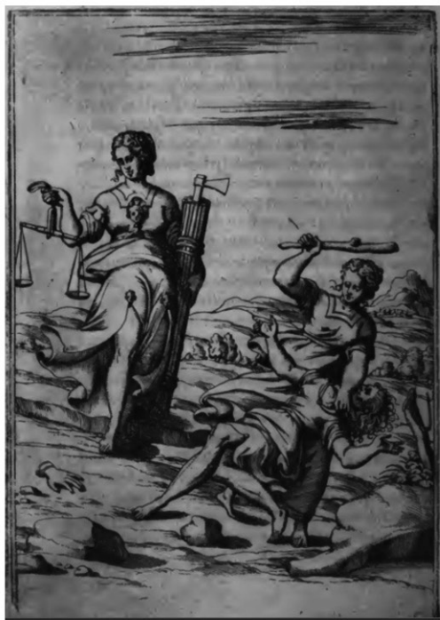
16 | Bolognino Zaltieri, Fortuna-Giustizia , incisione, in Vincenzo Cartari, Imagini delli dei de gl'antichi , 1571, p. 54.

Giano per sottolineare l'importanza simbolica della chiave quale strumento che “apre il mondo quando viene il dì a illuminarlo” (Catari 1556, 13). In questo caso l'alba di un nuovo giorno corrisponde al trionfo degli ugonotti. Per accelerare i tempi di realizzazione l'artista si è servito dello stesso cartone preparatorio impiegato per dipingere Minerva [Fig. 10], cambiando semplicemente il volto e gli attributi dei due personaggi. Alla destra di Giano, in corrispondenza della verga che serve a temprare il mondo (Cartari 1556, 13), troviamo una figura stante che mostra diverse influenze artistiche [Fig. 14]. Ritengo si tratti di un'allegoria della Giustizia