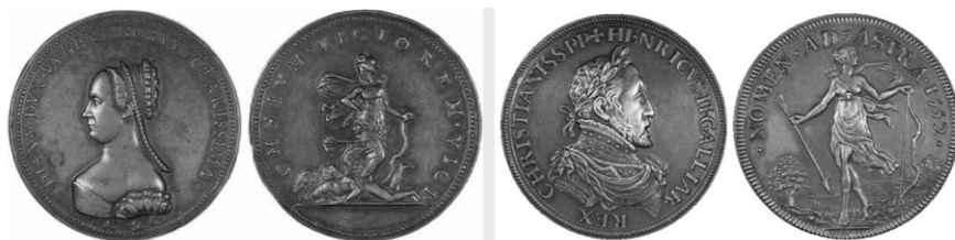
1 | Pierre Regnier (attribuito a), Diane de Poitiers , argento, 1610 circa (da un originale perduto del 1548), Londra, British Museum, inv. M.663.