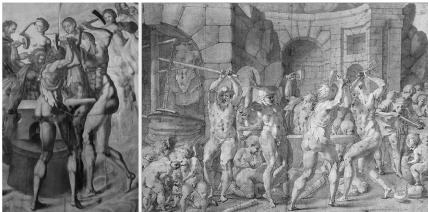
20 | Anonimo, Vulcano (dettaglio), affresco, 1560-1570 circa, Château de Tanlay, Tour de la Ligue.