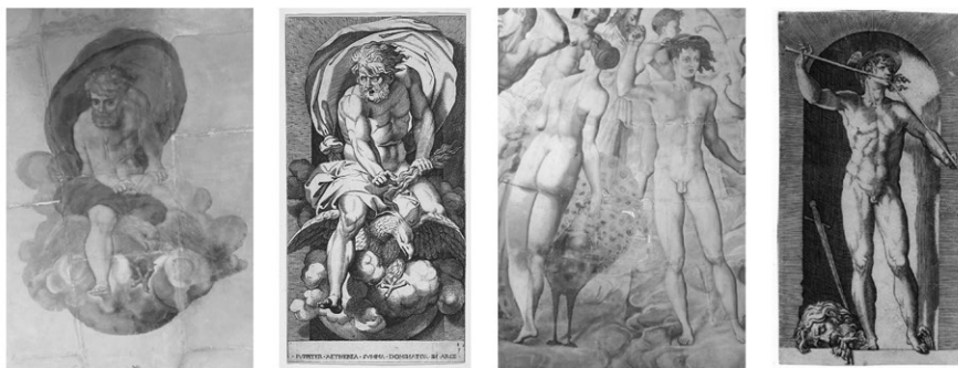
6-9 | Giove; Giove; Giunone e Mercurio; Mercurio.