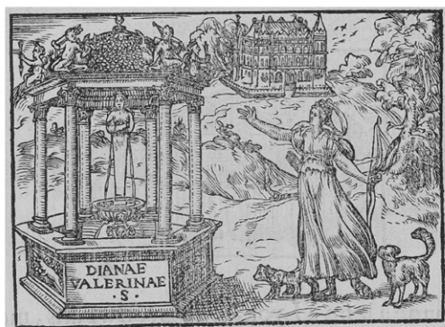
4 | Bernard Salomon, incisione, in Gabriele Simeoni, Les illustres observation antiques , Lyon 1558, 96.

go popolato da Muse, dove arte e letteratura trovano uno spazio ideale. L'incipit si collega alla nota di chiusura di La vita et metamorfoseo d'Ovidio in cui Diana viene descritta come la dea che “presta splendor nell'ombra”. Questa ambivalenza tra luce e ombra, dissolutezza e castità, ovvero Enrico II e Diane, viene descritta anche da Marguerite Yourcenar in un saggio dedicato al castello di Chenonceaux, dono del re alla duchessa di Valentinois: “Solo nel mondo dell'arte questa nudità, celata quasi agli occhi di tutti sotto i velluti e gli orpelli, si mostra con innocenza alla luce del sole; solo nel mondo dell'arte un'amante cinquantenne di re è un'immortale” (Yourcenar 2004, p. 63). La maggior parte delle opere d'arte commissionate o ispirate a Diane per decorare Anet vengono disperse durante la Rivoluzione Francese, quando il castello viene in parte demolito e spogliato dei suoi beni, incluse le fonti scritte (Hanser 2006, 16). La mancanza di documenti ha portato gli studiosi a confondere con Diane le effigi di numerose cortigiane in veste di Diana, come il ritratto di Diane de Poitiers en Diane del Musée de la Venerie di Senlis, oppure Diane chasseresse del Louvre. Distinguere la Diane de Poitiers immaginaria da quella reale rimane uno dei nodi più difficili da sciogliere.