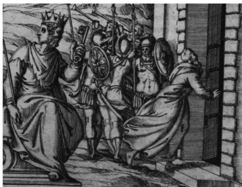
15 | Bolognino Zaltieri, Giano , incisione, in Vincenzo Cartari, Imagini delli dei de gl'antichi , 1571, p. 54.

Giano per sottolineare l'importanza simbolica della chiave quale strumento che “apre il mondo quando viene il dì a illuminarlo” (Catari 1556, 13). In questo caso l'alba di un nuovo giorno corrisponde al trionfo degli ugonotti. Per accelerare i tempi di realizzazione l'artista si è servito dello stesso cartone preparatorio impiegato per dipingere Minerva [Fig. 10], cambiando semplicemente il volto e gli attributi dei due personaggi. Alla destra di Giano, in corrispondenza della verga che serve a temprare il mondo (Cartari 1556, 13), troviamo una figura stante che mostra diverse influenze artistiche [Fig. 14]. Ritengo si tratti di un'allegoria della Giustizia