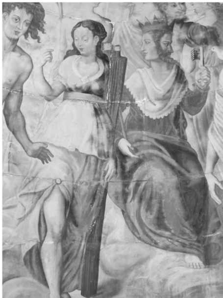
14 | Anonimo, Giano e Giustizia (dettaglio), affresco, 1560-1570 circa, Château de Tanlay, Tour de la Ligue.

Al centro di una corte popolata da figure stanti, l'unica figura assisa e incoronata è Giano bifronte, caratterizzata da un volto maschile e uno femminile. Nel celebre trattato intitolato Imagini delli dei de gl'antichi , Vincenzo Cartari descrive Giano come "guardiano e custode" delle porte del cielo. Nella princeps del 1556 leggiamo: