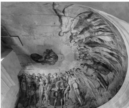
5 | Anonimo, affresco, 1560-1570 circa, Château de Tanlay, Tour de la Ligue.