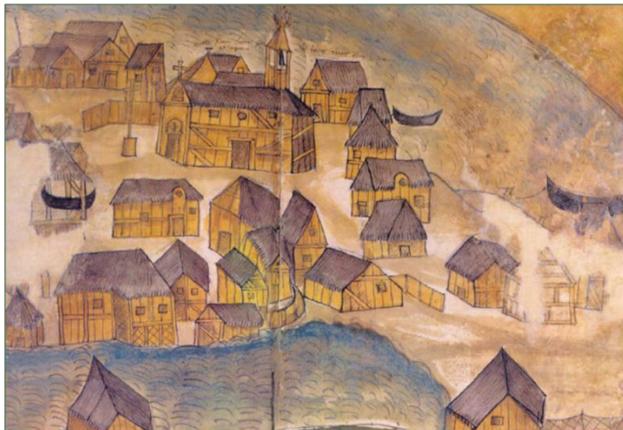
2 | Venezia in legno , disegno del XVI secolo (ma probabilmente copia di un disegno medievale piú antico), sito non ricostruibile con esattezza, ma collocabile nella laguna nord (Tomaso Diplovatacio, Tractatus de Venetae urbis libertate , Biblioteca Nazionale Marciana, mss. lat. XIV, n.77, cc. 22v-23r).

Dai dati noti, possiamo affermare che il 100% delle costruzioni civili lagunari (case, magazzini e edifici artigianali), avevano alzati in legno. Il legno era presente nei boschi e nelle foreste, ampiamente attestati in area costiera: lo provano le analisi sui pollini antichi e le letture dei carotaggi che permettono una ricostruzione accurata del paleo-ambiente. Il legno in laguna era il materiale da costruzione per eccellenza. Costituiva la cifra distintiva dell'intero spazio abitato. A Rialto, a Cittanova, a Torcello e a Comacchio il legno è abbondantemente attestato nella costruzione di waterfront , di rive, moli e approdi e per l'edilizia civile. Case, botteghe artigiane, magazzini e ricoveri per animali: lo spazio abitato ha edifici esclusivamente realizzati in tavole, assi e pali. Le pareti lignee erano spesso ben rifinite con argille, isolanti e intonaci (Fig. 3).