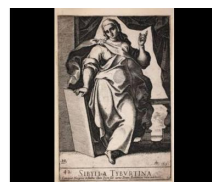
DIGITAL COLLECTIONS FULL ALPHABETICAL LIST - RECENTLY DIGITISED TITLES

11 | Página web The Warburg Institute Library, sección “Classification & Maps”. Mapa de “1st Floor & Basement”, categoría “Image”, 2011.