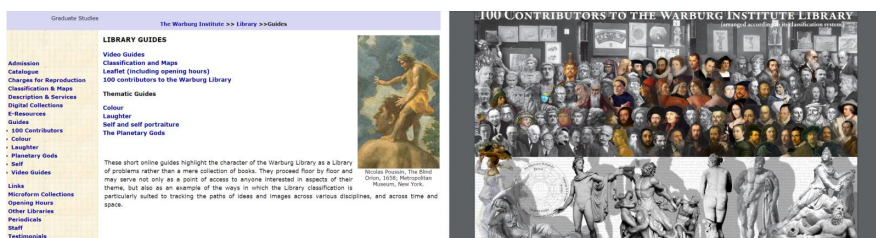
16 | Página web The Warburg Institute Library, sección “Library Guides”, 2015. 17 | Página web The Warburg Institute Library, sección “Library Guides”: “100 Contributors to The Warburg Institute Library”, 2015. Imagen con 100 personajes siguiendo el esquema de cuatro divisiones y cuatro pisos.

Imagen con 100 personajes siguiendo el esquema de cuatro divisiones y cuatro pisos; este centenar de contribuciones supone una especie de resumen de la historia de la biblioteca [Fig. 17]. Así en Imagen tenemos, entre una centena, a Velázquez y a Walter Benjamin, en el segundo piso la Palabra de Cervantes y Goethe, en el tercer piso la Orientación la disponen Raimundo Lulio o F.A. Yates y en el cuarto la Acción aparece con Cristóbal Colón y un sorprendente Aleister Crowley.