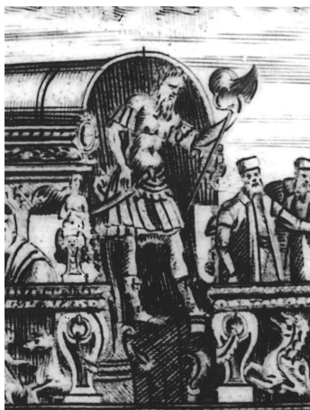
3 | Sadeler-Solari, Il meraviglioso Bucintoro , 1619 (collezione privata); particolare: la statua di Scanderbeg.

Nel nuovo Bucintoro che venne varato nel 1728 la statua del Gigante Scanderbeg lasciava il posto a un più generico Marte, che comunque schiacciava coi piedi “il fiero nemico del cristianesimo già tante volte atterrato” (così lo descrisse l’anno dopo Luchini in La nuova regia su l’acqua nel Bucintoro nuovamente eretto , Venezia 1729).