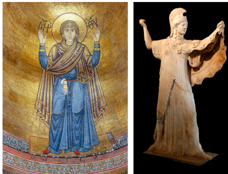
Madonna Deomene , mosaico, XI sec., Kiev, Chiesa di Santa Sofia. Atena Promachos , copia romana da Fidia, Napoli, Museo Archeologico.

L'immagine di Atena viene letteralmente sovrascritta in età bizantina: Atena Parthenos / Vergine Maria; Atena Promachos / Maria Symmachos . Durante l'assedio di Atene del 396 d.C. da parte di Alarico, lo storico bizantino Zosimo riporta che la dea Atena fu vista camminare lungo le mura della città "con aspetto identico a quello della sua statua, armata e pronta a resistere all'assalto"; nel Chronicon Paschale del VII secolo, è riportato che il Kagan degli Avari durante l'assedio della capitale bizantina del 626 vide la Vergine correre sulle mura di Costantinopoli (Pentcheva [2006] 2010, 90-91). Una fonte riferisce che il patriarca di Costantinopoli aveva fatto dipingere immagini della Vergine con bambino sulle porte della città (Kitzinger [1976] 1992, 43); Pentcheva [2006] 2010, 58, 92).