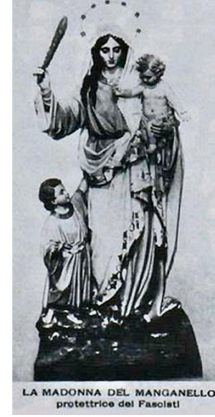
Madonna con Kalashnikov utilizzato in un sito camorristico. Vergine di Guadalupe armata per la rivoluzione messicana. Madonna con manganello in periodo fascista.

Icone come armi di un arsenale feroce e criminale che non meritano neppure di essere considerate eretiche. Papa Francesco ha mirato altrove, a obiettivi ben più seri, lanciando con forza il suo attacco allo scandalo promosso dai signori della guerra. Così ha dichiarato, il 21 marzo 2022: “La spesa per le armi è uno scandalo, non è una scelta neutrale [...] Continuare a spendere in armi sporca l’anima, sporca il cuore, sporca l’umanità. A che serve impegnarci nelle campagne contro la povertà, la fame, il degrado, se poi ricadiamo nel vecchio vizio della guerra, nella vecchia strategia della potenza agli armamenti che riporta tutto e tutti all’indietro?”. E con ancora maggior forza e mira il 24 marzo, quando il governo italiano ha deciso di incrementare le spese militari, ha ribadito: “Io mi sono vergognato quando ho letto che un gruppo di Stati si sono compromessi a spendere il due per cento del Pil per l’acquisto di armi come risposta a questo che sta accadendo – pazzi! [...] La risposta non sono altre armi ma un modo diverso di governare il mondo [...]. Il modello della cura è già in atto ma purtroppo è sottomesso a quello del potere economico, tecnocratico, militare”.