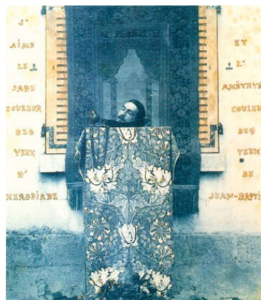
5 | Autore sconosciuto, Robert de Montesquiou in posa come San Giovanni decollato , 1885, cianotipo su cartone acquarellato, Collezione privata.

Per serendipity , il caso ha fatto in modo che Settis si sia imbattuto in precedenti dell'autodecapitazione di Duchamp più prossimi nel tempo. Una si deve al conte Robert de Montesquiou-Fézensac (1855-1921), esteta e dandy, fra i modelli del Des Esseintes di Huysmans ( À rebours , 1884) e di Charlus nella Recherche . Montesquiou si era fatto ritrarre da un fotografo travestito da san Giovanni decollato: la sua testa, con gli occhi chiusi, pare appoggiata su un vassoio, nel varco di una finestra da cui pende un drappo con decorazione floreale di William Morris. Questi i versi ai due lati dell'immagine, tratti da una poesia dello stesso Montesquiou ( L'irresponsable ) confluita nel volume Les Paons (1901): “J'aime le jade / couleur des yeux d'Hérodiade et l'améthyste / couleur des yeux de Jean-Baptiste”.