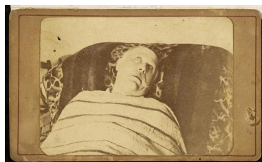
6 | Luigi Capuana, Autoritratto profetico , 1905.

Non era stato neppure il primo, l'autore del Marchese di Roccaverdina , a uscirsene con questo scherzo. Un autoritratto da morto aveva architettato anche uno dei primissimi sperimentatori del mezzo fotografico, Hippolyte Bayard (1807-1887), che a sua volta, forse alludendo a essere 'ucciso' da chi aveva concesso il brevetto della macchina fotografica a Daguerre, si era fatto rappresentare per polemica come annegato nella Senna. È il 1840, quando Bayard produce questa immagine pionieristica: appena un anno dopo il brevetto di Daguerre, dunque (Cortellessa 2022, 351-352). Settis parla per la ripresa dell'autoritratto fotografico con la forma tagliata ai tempi del Coronavirus di "un gioco di società un po' macabro". Proprio un gioco di società è anche quello di Capuana, che aveva inviato copie del Ritratto profetico ai suoi amici. Pare che Verga, trovandosene una fra le mani, si fosse preoccupato moltissimo. D'Annunzio aveva inviato in risposta una frettolosa ode metastasiana, per rassicurarlo e prenderlo un po' in giro.