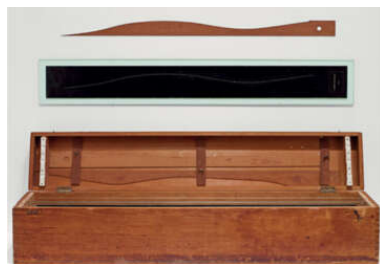
4 | Marcel Duchamp, 3 stoppages étalon , 1913-1914, legno, tela e vetro, New York, Museum of Modern Art.