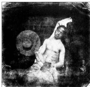
7 | Hippolyte Bayard, Autoritratto da annegato , 1840.