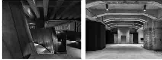
da sx: La rampa d'accesso al Luogo di Riflessione e il Muro dei Nomi; il foyer dell'auditorium.

strutturale della biblioteca. In tal modo si è ovviato al problema delle vibrazioni causate dallo scorrere dei convogli in superficie.