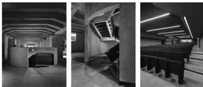
da sx: La scala circolare di collegamento tra il piano terra e il foyer al piano interrato; Particolare dello sbarco della scala al livello del foyer; Vista dell'auditorium (© Andrea Martiradonna).

All'interno del patio a piano interrato, a lato della grande sala di lettura, si possono evidenziare tutti i principi che hanno informato il progetto: il tema della soglia e della discontinuità, l'idea della percorribilità e del distacco dall'esistente, il ripristino delle superfici originarie delle strutture portanti, tutti elementi che sembrano concorrere ad uno "scavo archeologico" che è allo stesso tempo uno scavo nella memoria collettiva. Il Memoriale non è ancora terminato: il progetto, a causa della complessità del reperimento dei fondi, è realizzato per parti, ma nel percorrere quegli spazi è chiaro il preciso intento di trasformare l'episodio architettonico in un racconto, dove la discontinuità critica messa in evidenza dal progetto possa aprire ad una dimensione narrativa in grado di restituire allo spazio il carattere civile e collettivo che soltanto il disvelarsi della memoria può consentire.