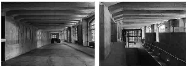
da sx: L'atrio d'ingresso e il muro con la grande scritta "Indifferenza"; la biblioteca vista dalla rampa d'ingresso al Memoriale (© Andrea Martiradonna).

piccola differenza di quota dovuta all'altezza del pianale dei camion che scaricavano la posta, costituisce la prima interruzione della continuità del suolo che dalla città si estende verso l'interno del corpo di fabbrica; l'idea del percorso attraverso una rampa, elemento di passaggio tra il rumore della città e il silenzio assordante di un'assenza, tra la luce e il buio, è marcato in maniera indelebile dalla presenza del muro nel quale è incisa la grande scritta "Indifferenza", parola scelta come significativa per una riflessione sull'Olocausto.