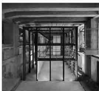
Il fronte interno della biblioteca durante le fasi di cantiere (© Andrea Martiradonna).

in cui le superfici in cemento armato a vista sono piene di lacune e di difetti, di parti distaccate e di imperfezioni. Questa ‘forzatura archeologica’, frutto di un intenso lavoro di collaborazione con la Soprintendenza per definire le modalità d’intervento, è la prima idea progettuale che ha consentito di istituire un dialogo con il luogo e con la sua storia. La ricerca dell’identità del luogo è avvenuta attraverso la messa in luce dei caratteri spaziali e materici, portando in evidenza la costruzione: qui forma e struttura coincidono. Un secondo principio che ha ispirato la progettazione è stato quello di dare forma allo spazio attraverso la natura dei materiali: cemento armato, ferro, legno, tutti elementi caratteristici degli ambienti ferroviari. Infine, il sottile lavoro di definizione delle corrispondenze, delle transizioni e delle discontinuità tra interno ed esterno, con la consapevolezza di non poter ottenere mai il senso di un’adesione al luogo: a queste superfici non si può aderire, non è possibile venire a patti con questa struttura; era necessario, secondo l’approccio dei progettisti, tenere una “distanza critica”, una “discontinuità” che costituisse la ragion d’essere del progetto architettonico; la rampa è totalmente sollevata dal suolo, così come la biblioteca è completamente autonoma rispetto alle strutture del complesso della stazione e ha una struttura portante libera con doppi solai e ammortizzatori.