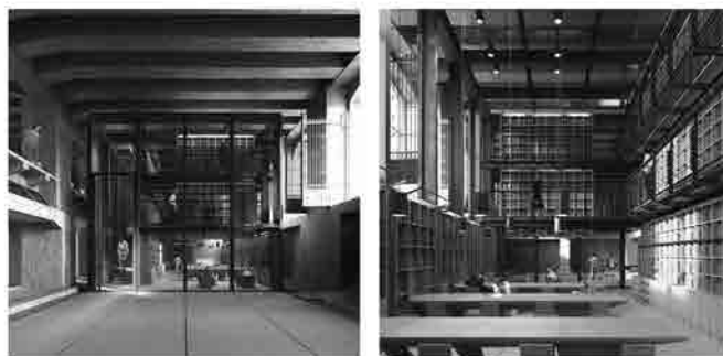
da sx: Render del fronte della biblioteca; Vista della sala di lettura della biblioteca verso il patio in un render di progetto (© Morpurgo de Curtis Architetti Associati).

All'interno del patio a piano interrato, a lato della grande sala di lettura, si possono evidenziare tutti i principi che hanno informato il progetto: il tema della soglia e della discontinuità, l'idea della percorribilità e del distacco dall'esistente, il ripristino delle superfici originarie delle strutture portanti, tutti elementi che sembrano concorrere ad uno "scavo archeologico" che è allo stesso tempo uno scavo nella memoria collettiva. Il Memoriale non è ancora terminato: il progetto, a causa della complessità del reperimento dei fondi, è realizzato per parti, ma nel percorrere quegli spazi è chiaro il preciso intento di trasformare l'episodio architettonico in un racconto, dove la discontinuità critica messa in evidenza dal progetto possa aprire ad una dimensione narrativa in grado di restituire allo spazio il carattere civile e collettivo che soltanto il disvelarsi della memoria può consentire.