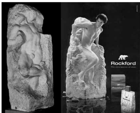
a sin. Michelangelo Buonarroti, Prigione (1519-1536) a dex. Immagine pubblicitaria per un profumo per uomo (Italia, 2001)