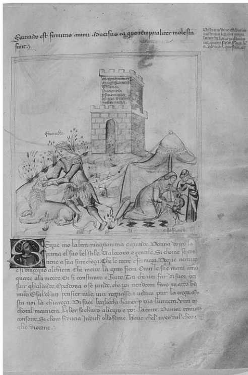
2 | Bartolomeo e Andrea de' Bartoli, Fortitudo e le sue partes . Chantilly, Musée Condé, ms. 1426, f. 3r.

A cornu Epistulae , non è rappresentato solo Oloferne (“Ollolfernes” nel titulus ), schiacciato dalla Fortitudo come Sardanapalo dalla Prudentia , ma una scena più articolata, in rapporto con la tradizione iconografica che ha