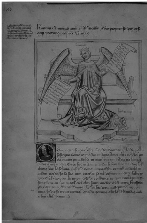
7 | Bartolomeo e Andrea de' Bartoli, Charitas e le sue partes . Chantilly, Musée Condé, ms. 1426, f. 5v.

attestata da Bartolomeo è nel frammentario, bolognese ms. it. 112 della Bibliothèque Nationale di Parigi, f. 16v, di cui andranno studiati i rapporti con il manoscritto di Chantilly: “Sperno deos, fugito periuria, sabata colo. / Habens uni Deo amorem timorem amorem. / Sit tibi patris honor, sit tibi patris [per “matris”] amor. Non sis ociosus [per “occisor”]):