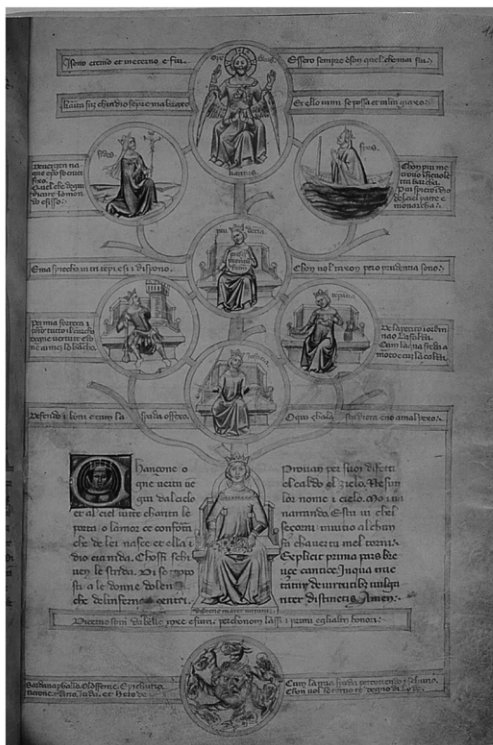
8 | Bartolomeo e Andrea de' Bartoli (?), L'albero delle Virtù , Chantilly, Musée Condé, ms. 1426, f. 6r.

sguainata, ma regge con l'altra mano, invece di un libro, una bilancia. La Fortezza lascia alle spalle la coreografia del combattimento di Sansone con il leone, e pure la Giuditta "tagliatrice di teste": è sola, con una piccola torre nella mano sinistra, e nella destra una clava di Ercole. La Temperanza non ha più la sua torre in cui chiudere a chiave ciò che è sfrenato, ma è dotata di una brocca d'oro e un bacino d'argento, strumenti nobili per ottenere tiepidezza. Solo la Prudenza, che come depositaria della Memoria ha un ruolo privilegiato nel "libro d'autore" (nel senso in cui impiega questo termine Petrucci 2017), si mantiene fedele a se stessa: nella destra ha un cero acceso, nella sinistra un disco-specchio semplificato rispetto a quello del f. 2v, dove si leggono le sole parole: "Presens preteritum et futurum". Bastava quello, in effetti.