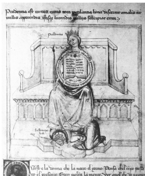
1 | Bartolomeo e Andrea de' Bartoli, Prudentia e le sue partes . Chantilly, Musée Condé, ms. 1426, f. 2v (da Dorez 1904).

dimenticate all'interno dello specchio, sopra il libro che vi è incluso o riflesso, una sfera nera che un titulus qualifica come “nox”; e sotto il libro, un'altra, bipartita di bianco e di azzurro, con il titulus “dies”.