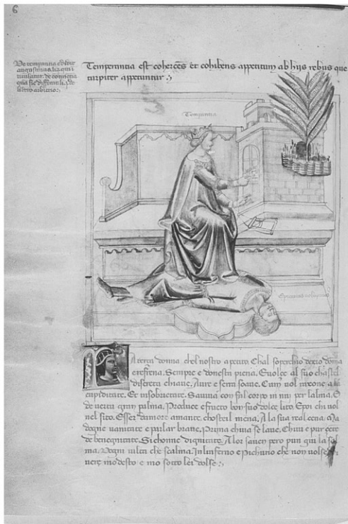
3 | Bartolomeo e Andrea de' Bartoli, Temperantia e le sue partes . Chantilly, Musée Condé, ms. 1426, f. 3v.

La terza donna che 'l nostro apeto Ch'ha 'l soperchio dexio, domma e refrena, Sempre è d'onestà piena E volse al suo chastel discreta chiave: Avre e serra soave, Cum vol raxone a la cupiditate, Et in sobrietate S'aviva, con fa 'l corpo in nui per l'alma E de vertù gran palma Produce e fructo bon suo dolce lito: