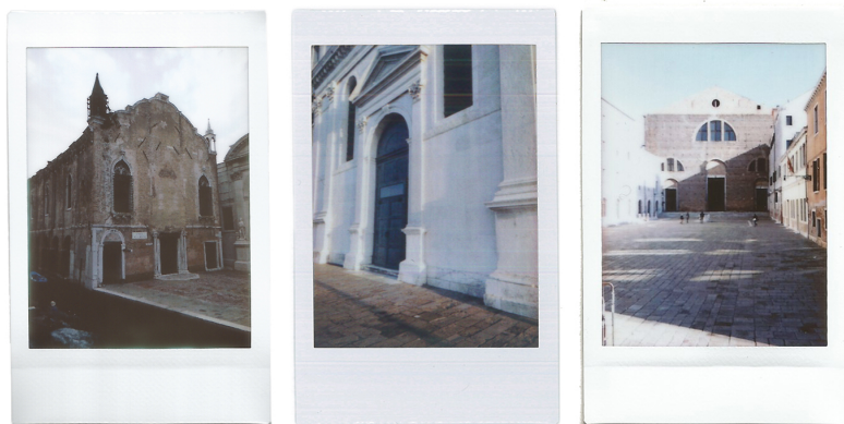
Chiesa della Misericordia, Chiesa di Santa Maria della Presentazione, Chiesa di San Lorenzo, progetto fotografico Chiese Chiuse , Sissi Cesira Roselli, Venezia 2014.

sopraelevabili, dei notevoli spessori dei muri e delle grandi superfici vetrate, della mancanza di impianti e della scarsa flessibilità dell'edificio. Questo aspetto è determinato dal fatto che le chiese siano vincolate in termini normativi oltre che paesaggistici, da cui derivano una serie di limitazioni di progetto e un allungamento dei tempi burocratici di permessi e di tutela (Marini, Roversi Monaco 2017).