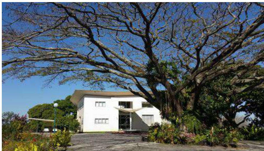
1 | Docomomo Venezuela ISC Technology, Villa Planchart , facciata est, 2018.

“Non c’è ragione perché l’architetto continui [...] a concepire il restauro come un torneo cavalleresco tra il vecchio e il nuovo, dove il restauro ‘riuscito’ è un monumento morto con l’onore delle armi.