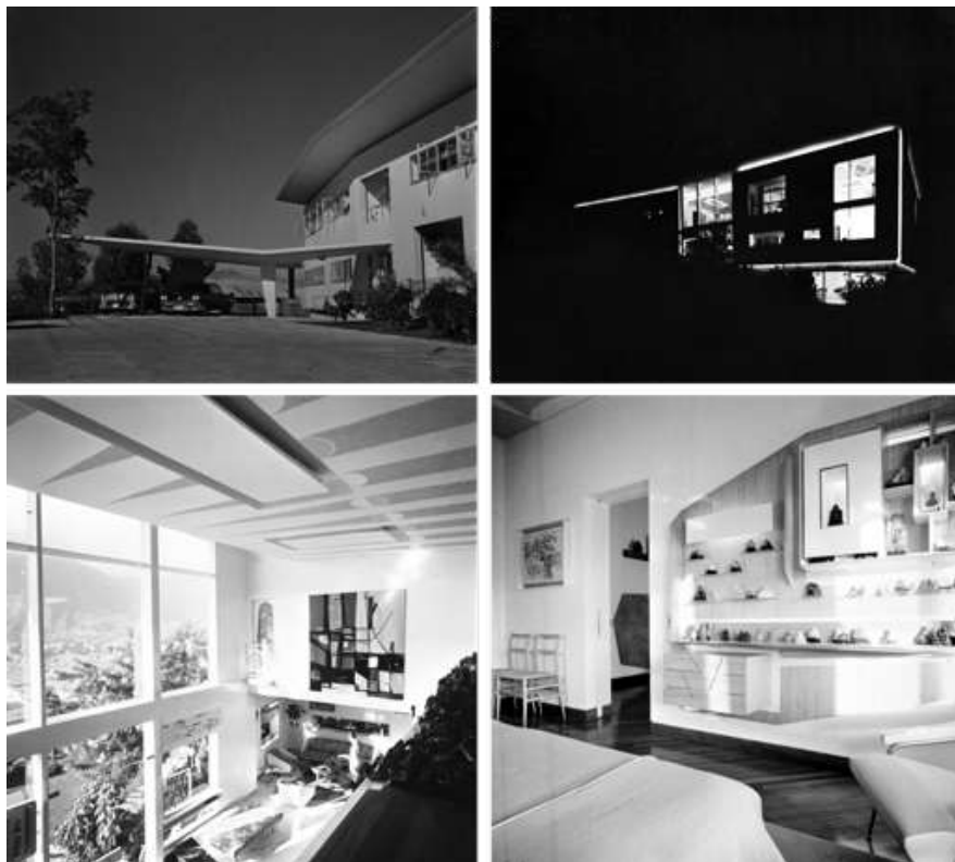
3 | Giorgio Casali, Villa Planchart , facciata sud, veduta esterna diurna, 1953-57, negativo su vetro. Università luav di Venezia, Archivio Progetti, fondo Giorgio Casali, inv. 041193-1.