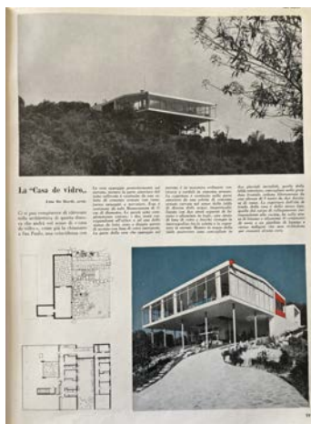
13 | La prima pagina dell'articolo La "Casa de vidro" di Gio Ponti, da "Domus" 279 (febbraio 1953).

Come abbiamo visto, Bo Bardi finì per prendere mano a mano le distanze dal proprio paese di origine. Diversamente da molti emigrati, arrivò addirittura a negare la propria provenienza, a considerarla come un puro e semplice (nonché trascurabile) accidente. Ciò che però omise sempre di dire è che questa presa di distanza fu l'esito di un lungo processo. Soltanto in alcune lettere del 1956 arriverà a dichiarare di essersi finalmente decisa per il paese in cui si trovava a vivere. Dal che si evince che sino a quel momento, e quindi proprio negli anni in cui fu direttrice di "Habitat", era lei stessa a sentirsi a metà tra Italia e Brasile.