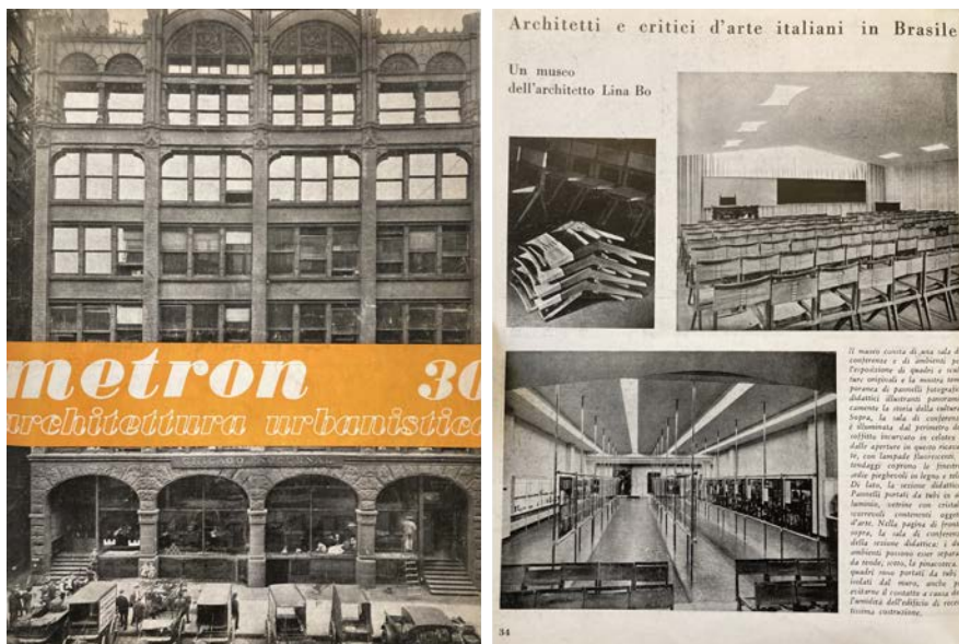
11-12 | La prima pagina dell'articolo anonimo Architetti e critici d'arte italiani in Brasile . Un museo dell'architetto Lina Bo, preceduto dalla copertina della rivista, da "Metron" 30 (dicembre 1948).