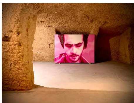
4 | Abel Herrero, "Éter", Matera, Ipogei Motta, 2021.

Le tele nella 'cappella' ripropongono una tecnica da tempo adottata da Herrero, quella della saturazione : i colori puri della stampa in quadricromia (ciano, magenta, giallo e nero) negano qualsiasi figura, ma se ci avviciniamo alla superficie dei quattro grandi monocromi ci avvediamo di come il 'rumore' che li oscura sia prodotto da un caos di algoritmi numerici, codici digitali del web, i geroglifici cioè che oggi segretamente governano l'informazione e, lei tramite, tutti noi che la consumiamo; e alla stessa oscurità di ritorno allude il brusio visivo del televisore fuori sintonia. L'unione di queste tecniche ha un precedente in Éter , l'ultimo lavoro esposto da Herrero due anni e mezzo fa negli Ipogei Motta a Matera: la stessa funzione dell'icona sacrificale di Assange veniva assolta, in quell'occasione, da quella di Enrique Irazoqui, il carismatico Cristo guerriero nel Vangelo secondo Matteo di Pasolini (un film girato, a suo tempo, proprio in quei Sassi).