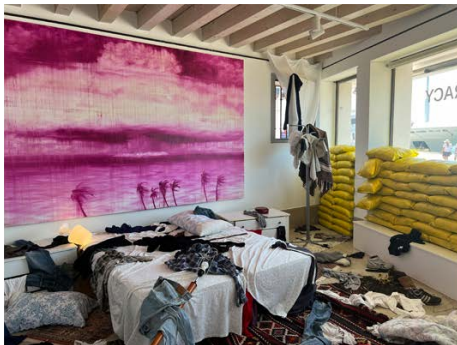
2 | Abel Herrero, "Cromocracy", 2022, Venezia, Galleria Castello.

Qualche passo fra le rovine e accediamo alla stanza accanto, dove sulle pareti splendono oscure quattro grandi tele monocrome, formicolanti segni senza referente, che fanno corona a un'unica immagine riconoscibile, realizzata con la stessa tecnica ma dalla quale emerge il volto di un uomo. L'insieme può ricordare un'iconostasi, uno spazio simile alla celebre Cappella di Mark Rothko a Houston: al centro però, a differenza di quel sublime suprematismo nichilista, resiste un riferimento umano.