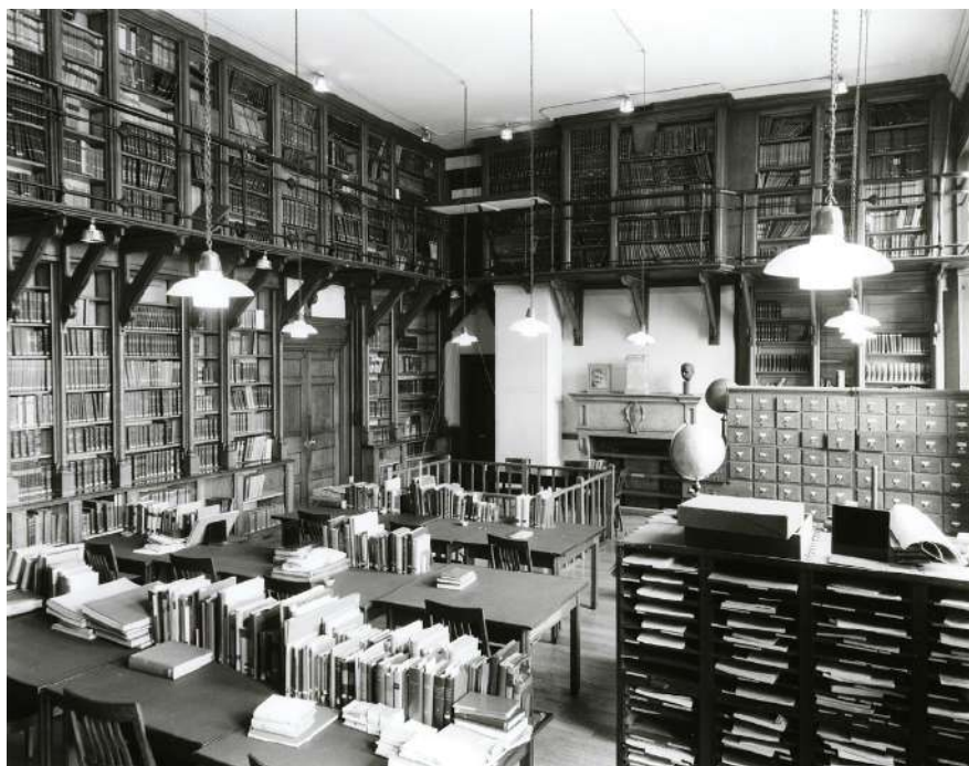
1 | Sala di lettura del Warburg Institute presso l'Imperial Institute di South Kensington tra il 1936 e il 1957.

Gertrud Bing, The Warburg Institute , "The Library Association Record" Fourth Series, IV, 8 (1934), 262-266, ripubblicato in G. Bing Notes on the Warburg Library (1934) , edited by Seminario Mnemosyne, "La Rivista di Engramma" n. 177, novembre 2020, 15-23.