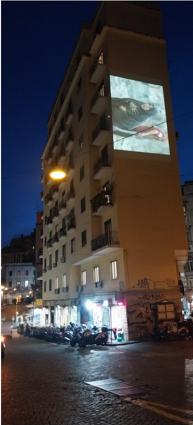
Proiezione da Palazzo Degas, Calata Trinità Maggiore, di Qui resteremo , a cura dell'archivio Gaza_Fuorifuoco_Palestina, Napoli, 29 novembre-2 dicembre 2025.

“K” immagina, allora, di costruire un montaggio di scritte e immagini, per raccontare e mostrare altrimenti – cioè al di là delle sue possibili e diffuse giustificazioni – la storia che stiamo vivendo, la distruzione della Palestina di cui siamo spettatori e spettatrici. Il patrimonio culturale è, in questa operazione, il luogo in cui rintracciare la genesi del genocidio del popolo palestinese e la sparizione della sua striscia di terra, nonché la zona in cui è in gioco la cartografia dei poteri politici contemporanei. Si tratta, quindi, di scovare una maniera per resistere all’interno del discorso dominante della cultura occidentale che giustifica il genocidio del popolo palestinese in maniera oscura, cioè, per dirla in una battuta: in nome dell’umanità. D’altronde, Benjamin, ancora in Esperienza e povertà , mostra come la cultura che, nel 1933, permette e giustifica l’avvento della barbarie, si basi sull’immagine tradizionale di un’umanità a sua volta fondata su logiche sacrificali del passato.