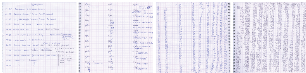
3 | Dal blocnotes utilizzato durante l'azione.

anch'esse una forma di resistenza che fa quasi tenerezza, rispetto alla inflessibile esattezza dell'ordine numerico.