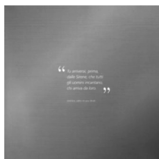
“Tu arriverai prima/ dalle Sirene, che tutti gli uomini incantano/ chi arriva da loro” (seconda di copertina)