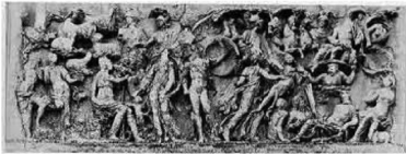
Sarcofago di Villa Medici con il Giudizio di Paride

Accogliendo l'ipotesi che un modello di Raffaello possa essere stato il sarcofago di Villa Medici, andiamo a verificare puntualmente quali siano le lezioni congiuntive e disgiuntive tra antigrafo e apografo. In questa operazione di confronto di dettagli è utile ricorrere, oltre che all'immagine fotografica del pezzo archeologico, anche a un'incisione cinquecentesca esemplata dal sarcofago, opera di Giulio Bonasone, non artisticamente eccelsa ma già segnalata dallo stesso Warburg perché riproduce molto fedelmente i dettagli del modello antico e ci restituisce anche lo stato di leggibilità che il sarcofago presentava al tempo di Raffaello. Nel confronto va tenuto in conto il fatto che, mentre il sarcofago antico, come è evidente dall'incisione di Bonasone, presenta un compendio di diversi episodi della storia del Giudizio, Raffaello sceglie di rappresentare soltanto la scena della contesa.