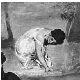
Manet, Déjeuner sur l'herbe (particolare)