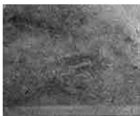
Affresco di Castelfranco (particolare)