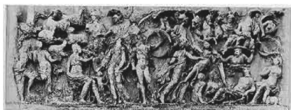
Sarcofago di Villa Medici con il Giudizio di Paride

In particolare per il gruppo delle due figure sulla destra – il dio Fiume e la ninfa – Raffaello (giusta Raimondi) avrebbe tratto bensì ispirazione dal sarcofago di Villa Medici, ma avrebbe introdotto però una significativa variante rispetto al modello: la ninfa che “nell’arte pagana leva estaticamente adorante il capo verso le meraviglie dell’alto [i.e. verso il ritorno di Venere all’Olimpo] nell’incisione volge la testa al contemplante mondo esterno”.