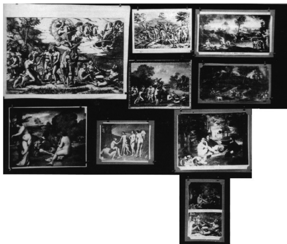
Dalla 'ninfa' di Giorgione a Victorine di Manet: particolare da Atlas Mnemosyne, Tavola 55

Refusés, poteva vantare un pedigree autorevole. Il montaggio di tavola 55 ci indica chiaramente i motivi e i percorsi attraverso i quali, secondo Warburg, la Ninfa approda sulla tela del pittore: se per il tema e per la composizione Manet si era ispirato al Concerto campestre di Giorgione, la posa impertinente della sua scandalosa Victorine (Victorine Meurent, la modella prediletta dell'artista) ha un precedente illustre in un'incisione di Marcantonio Raimondi da Raffaello.