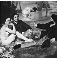
Affresco di Castel Franco (particolare)