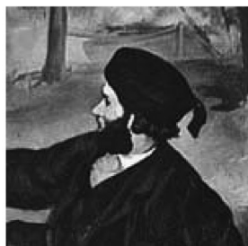
Affresco di Castel Franco (particolare)