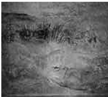
Affresco di Castelfranco