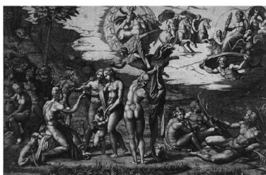
Incisione di Marcantonio Raimondi raffigurante il Giudizio di Paride