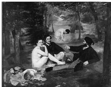
Edouard Manet, Dejeuner sur l'herbe , olio su tela, 1863, Parigi, Musée d'Orsay

Abbiamo così ricostruito il ruolo di un ulteriore, possibile 'testo mediatore' – un altro anello nella catena che conduce dai sarcofagi romani a Manet. Questa ricostruzione certifica, con ancora più forte evidenza, che la supposta invenzione provocatoria di Manet si iscrive invece perfettamente nella serie di riprese e citazioni di un soggetto – concerto campestre con ninfa – che, come attestano i testimoni plurimi (Raffaello, Raimondi, Giorgione-Castagnola, Manet) ha una buona fortuna per tutta la prima metà del XVI secolo, e che, dopo più di tre secoli di latenza, Manet riesuma. In questo senso l'artista che dà scandalo e che épate le bourgeois è da considerare al contrario, secondo la definizione tecnica del mancato banchiere Warburg "un fidato amministratore dell'eredità della tradizione" (Warburg [1929] 1984) e in particolare della tradizione dei maestri italiani del Cinquecento (sugli attacchi critici che Manet subì per la sua opera "volgare e maliziosa" vedi da ultimo: Pellizzer 2004).