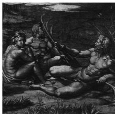
Sarcofago di Villa Medici con il Giudizio di Paride (particolare).