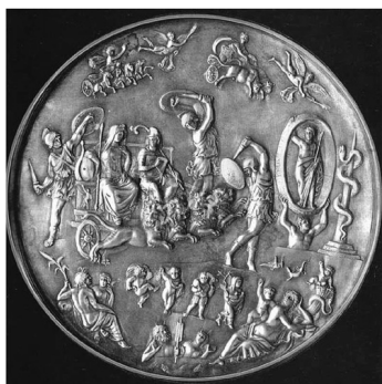
Patera di Parabiago, Milano, Museo Archeologico

Nel 1907 a Parabiago, in provincia di Milano, fu rinvenuta una patera d'argento di pregevole fattura, un tipo di piatto ornamentale usato anche come copertura di urne cinerarie.