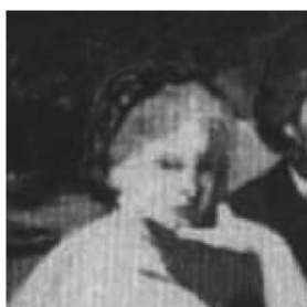
Bozzetto per il Dejeuner del Couthaul Institute (particolare)

Agli argomenti di Lovato si può aggiungere un altro elemento. Esiste anche una variante del dipinto che Manet predispose poco prima del 1863, oggi conservato presso il Courtauld Institute di Londra, che ritrae la ninfa nella medesima posizione, ma con i capelli fermati da una ghirlanda o cuffia: la stessa acconciatura che, a quanto è dato di vedere, la ninfa porta nel 'modello' giorgionesco di Castelfranco*.