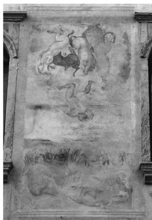
Affresco di Castel Franco raffigurante la Caduta di Fetonte

Accostando il particolare dell'affresco di Castel Franco all'opera di Manet le somiglianze paiono stringenti: l'ambientazione e la postura dei personaggi ricalcano il profilo delle figure dell'affresco giorgionesco, più che le figure dell'incisione cinquecentesca: in particolare "la figura del fiume di destra è esattamente nella posa del personaggio con il berretto di Manet e la sua gamba destra è esattamente come nel dipinto impressionista e non come nel modello inciso" (LOVATO 1996, p. 51). A questo importante dettaglio si aggiunge il fatto che "la nota bagnante sul fondo, che non esiste in Raimondi, la ritroviamo nell'affresco e si intravedono anche degli oggetti in primo piano paralleli alla natura morta di Manet" (Lovato 1996, 51).