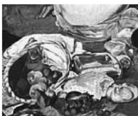
Manet, Déjeuner sur l'herbe (particolare)

Agli argomenti di Lovato si può aggiungere un altro elemento. Esiste anche una variante del dipinto che Manet predispose poco prima del 1863, oggi conservato presso il Courtauld Institute di Londra, che ritrae la ninfa nella medesima posizione, ma con i capelli fermati da una ghirlanda o cuffia: la stessa acconciatura che, a quanto è dato di vedere, la ninfa porta nel 'modello' giorgionesco di Castelfranco*.