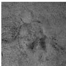
Affresco di Castelfranco (particolare)