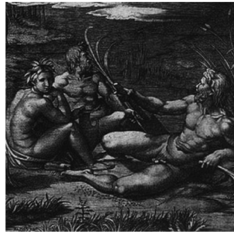
Patera di Parabiago (particolare) Marcantonio Raimondi, Giudizio di Paride (particolare)

Ovviamente non può trattarsi di una deduzione diretta: Raffaello non poteva aver visto la nostra patera, rinvenuta in una tomba nel 1907. Ma l'esistenza della Naiade di Parabiago attesta che il motivo del Fiume con Ninfa, in questa precisa postura (mano al volto e sguardo diretto fuori della composizione) è presente già in età tardo antica. Si ipotizza quindi l'esistenza di un modulo di repertorio – la coppia Fiume-Naiade girati in un senso (variante A: Fiume di spalle in primo piano/ Naiade di fronte in secondo piano, come nella Patera) o nell'altro (variante B: Naiade di spalle, in primo piano/Fiume di fronte in secondo piano, come nell'incisione Raimondi ex Raffaello): il gruppo Fiume con Naiade poteva evidentemente essere inserito in composizioni di tipo diverso (ma è forse significativo che i nostri esemplari, dal sarcofago alla Patera, siano comunque scene