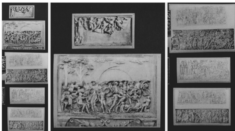
Sarcofagi romani raffiguranti il Giudizio di Paride in Atlas Mnemosyne, Tavola 4

di trasmissione in cui un ruolo importante è svolto dal ‘testo mediatore’ (l’incisione di Marcantonio Raimondi da Raffaello); all’interno del gruppo di tavole 4-8 che presentano le le “Preformazioni” (ovvero i modelli antichi) Warburg esibisce anche i ‘modelli originali’ in una serie di sarcofagi datati al II secolo d.C. che hanno come soggetto il Giudizio di Paride.