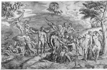
Giulio Bonasone, incisione dal sarcofago di Villa Medici