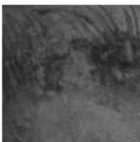
Affresco di Castelfranco (particolare)

Se come Manet stesso proclama per difendersi dagli attacchi della critica l'ispiratore del soggetto del suo Déjeuner era Giorgione e i suoi Concerti campestri, l'esistenza di ben tre e forse quattro lezioni congiuntive tra l'affresco di Castelfranco e l'opera del pittore pare certificare che anche nei dettagli formali l'ispirazione possa essere venuta all'artista direttamente da un'opera (ritenuta) giorgionesca piuttosto che dall'incisione raffaell'esca. Vero è che a metà dell'800, anche grazie alle prime riproduzioni