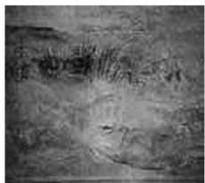
Giorgione, Concerto Campestre (particolare)