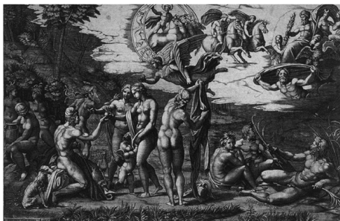
Incisione di Marcantonio Raimondi raffigurante il Giudizio di Paride