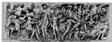
Sarcofago di Villa Medici con il Giudizio di Paride

fotografiche erano in circolazione copie delle incisioni di Raimondi: ma è più facile ipotizzare la suggestione su Manet dell'affresco giorgionesco esposto sulla piazza di Castelfranco, certamente più accessibile. La successione si lascia dunque così riordinare: